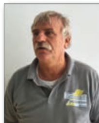
Lutz Detring Friedrich Schmidt Bedachungs GmbH