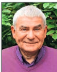
Detlef Mauritz Kinderhospiz Löwenherz