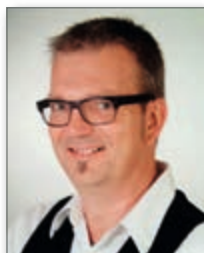
Frank Büter Weser-Kurier