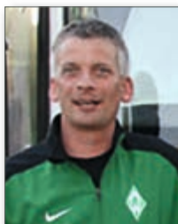
Frank Cordes Sausner Reisen